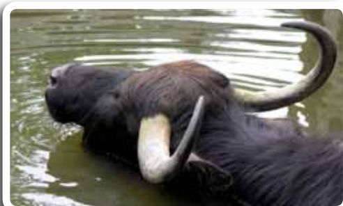
Landschaftspfleger für das Fließtal.

Was sich zunächst wie ein vorgezogener Aprilscherz anhört, hat doch einen konkreten Hintergrund. Seit mehreren Jahren stehen die Wiesen im Fließtal immer häufiger unter Wasser