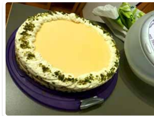
Auch als Hochzeitstorte sicherlich ein Gaumenschmaus.

Den Teig in der Kastenform backen. Wenn der Kuchen kalt ist mit einem Päckchen Puderzuckerguss übergießen oder wer keinen Guss mag nur mit Puderzucker bestäuben. Oder den Teig in einer Rundform backen und abkühlen lassen. Ein Liter Sahne mit Zucker und fünf Päckchen Sahnesteif schlagen und auf den Kuchen mit Hilfe eines Tortenrings verteilen. Den