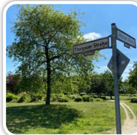
Grundschulstandort: Arosener Allee/ Thurgauer Straße