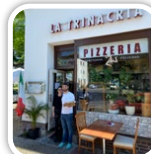
La Trinacria in der Arosener Allee 140, 13407 Berlin

So auch die Trattoria La Trinacria – der Familienbetrieb in der Arosener Allee 140, 13407 Berlin bietet aber – wie viele andere Gastronomen in Reinickendorf-Ost – nun neben dem Außenverkauf auch wieder die Möglichkeit eines schönen Restaurantbesuchs. Dort warten leckere Spezialitäten und italieni-