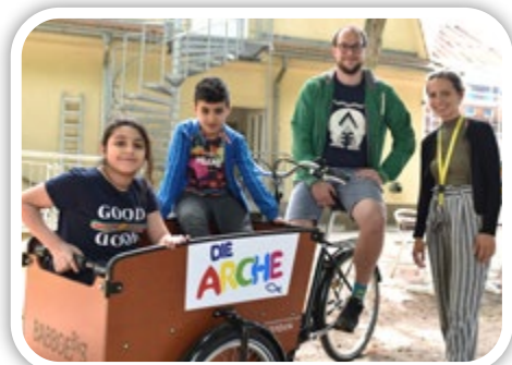
Arche Reinickendorf.

Seit rund zehn Jahren gibt es jetzt das christliche Kinder- und Jugendwerk die Arche in Reinickendorf. Rund 60 Kinder besuchen werktags die Einrichtung. Sie starten mit einem kostenlosen Mittagessen, können Sport treiben, spielen, ihre Hausaufgaben zusammen mit ehrenamtlichen und hauptamtlichen Mitarbeitern machen, einfach nur chillen oder – ganz wichtig – über ihre Sorgen und Probleme sprechen. Zurzeit dürfen leider nur bis zu 12 Kinder zu unterschiedlichen Zeiten in die Arche kommen. Auch die Arbeit der Einrichtung hat natürlich unter der Corona Pandemie gelit-