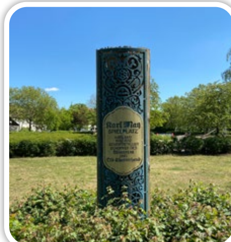
Karl May Spielplatz

– erst für das Schuljahr 2023/24 erwartet werden können. Das ist jedoch viel zu spät! Der dringende Bedarf an Grundschulplätzen in unserem Kiez ist schon im Schuljahr 2022/23 vorhanden und dies ist auch schon lange bekannt, schließlich warten wir nun schon seit nunmehr 8 Jahren!