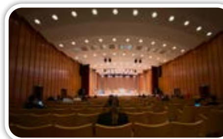
BVV-Sitzung im Ernst-Reuter-Saal.