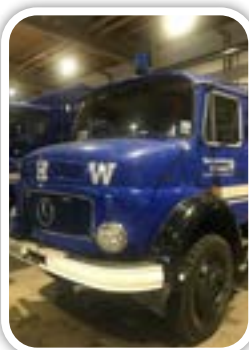
Der Standort des THW Berlin-Reinickendorf ist in der Flottenstraße.

Z um Ende des Jahres blicken wir immer auch zurück auf die Ereignisse, die uns im vergangenen Jahr am meisten bewegt haben und dazu gehörte natürlich die Flutkatastrophe in NRW und Rheinland-Pfalz am 14.07.2021, welche über einhundert Menschenleben kostete und großflächige Zerstörung von Häusern, öffentlichen Einrichtungen und Infrastruktur zur Folge