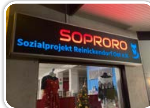
Sozialprojekt Reinickendorf Ost e.V., Roedernallee 88-90, 13437 Berlin

Unterstützung sozialer und karitativer Projekte