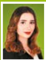
Eda Yapan Versicherungskauffrau im Außendienst