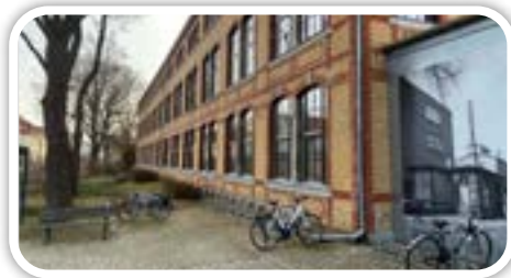
Blick vom Freiheitsweg in Reinickendorf-Ost

Verglichen mit anderen Berliner Bezirken mit bekannten historischen Gebäuden wirkt Reinickendorf manchmal wie ein recht junger Bezirk, dabei wurde „Reinhardts Dorf“ bereits 1240 gegründet und gehört seit 1297 zu Berlin. In der Straße Alt-Reinickendorf 25-27 findet sich ein Zeugnis aus dem Zeitalter der Industrialisierung, welche Reinickendorf stark geprägt hat, ein – mittlerweile unter Denkmalschutz stehendes – Fabrikgebäude aus dem Jahr 1898. Der Backsteinbau wurde vom Architekten R. Hoffmann entworfen und diente ursprünglich als Schraubenfabrik. Über die Architektur des Gebäudes sowie die verschiedenen Verwendungen durch unterschiedliche Firmen während des 20. und 21. Jahrhunderts informiert nun