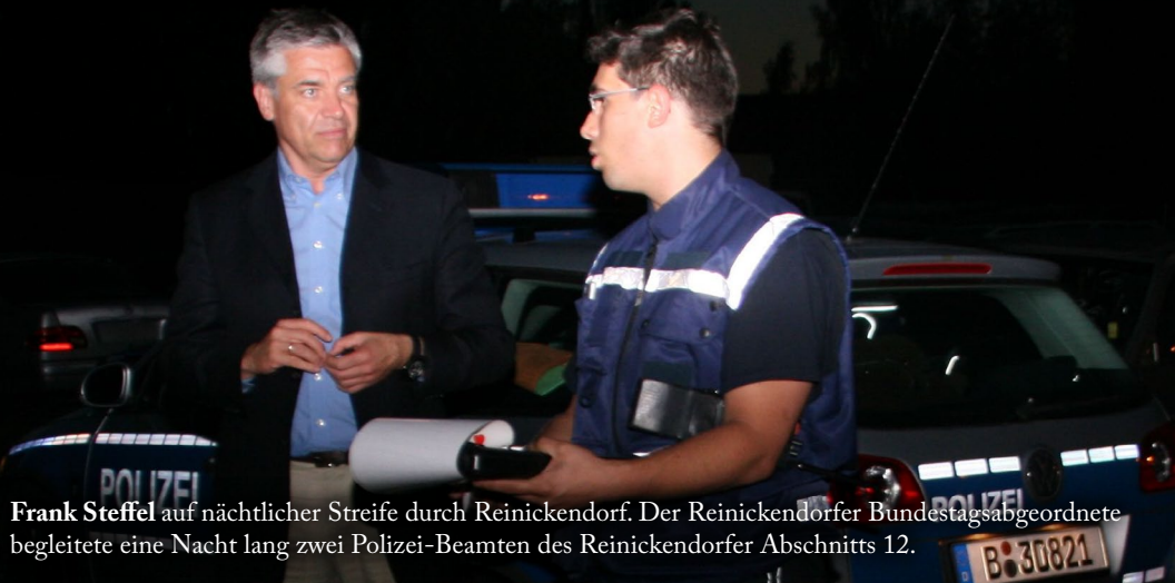
Frank Steffel auf nächtlicher Streife durch Reinickendorf. Der Reinickendorfer Bundestagsabgeordnete begleitete eine Nacht lang zwei Polizei-Beamten des Reinickendorfer Abschnitts 12.