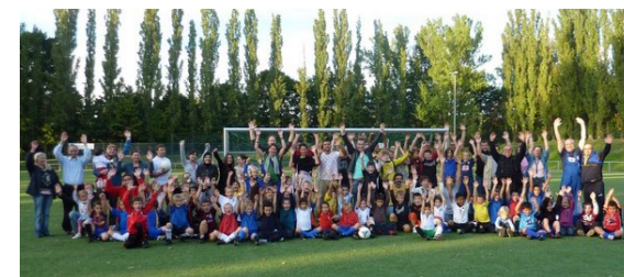
Mitglieder des BFC Alemannia 1890 e.V.