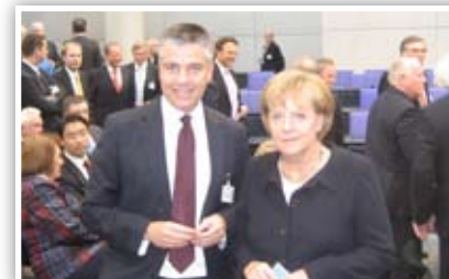
Damit Angela Merkel Kanzlerin bleibt, braucht die CDU am Wahlsonntag Ihre beiden Stimmen