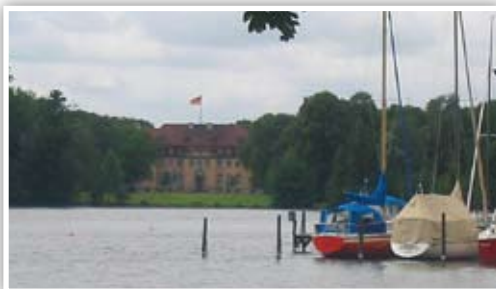
Idyllisch gelegen: Die Villa Borsig beherbergt das Gästehaus des Bundesaußenministers

wärtiger Dienst“ den Blick auf den Tegeler See genießen: Und zwar im Seepavillon, dem ehemaligen französischen Offizierskasino. Dieser dient der Akademie als Kantine und ist abends und an Wochenenden auch für die Öffentlichkeit geöffnet.