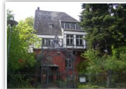
Adelheid und ihre Senioren: Kommen Sie doch mal vorbei

li 2003 sowie das 30-jährige Bestehen des Clubs im letzten Jahr. Jedes Jahr wird auf dem weitläufigen wunderschönen Gelände ein Sommerfest veranstaltet. Im Winter werden behindertengerechte Tagesausflüge organisiert.