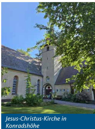
Jesus-Christus-Kirche in Konradshöhe

Der mich atmen lässt. Ich glaube an einen lebendigen und lebensbejahenden Gott. Der Glaube hilft mir bei Aufatmen, wenn ich mich frage, wer ich in dieser verrückten Zeit wo und wie bin. Ich bin eingeladen zum Fest des Lebens.