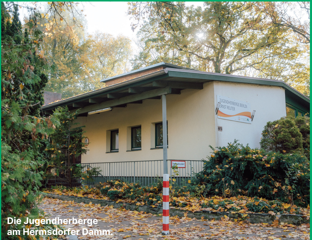
Die Jugendherberge am Hermsdorfer Damm.