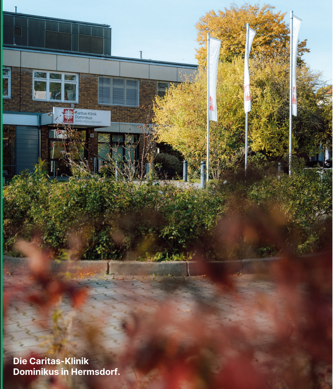
Die Caritas-Klinik Dominikus in Hermsdorf.